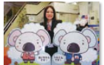
あいしんキャラクター

3月 1日 キャラクター登場キャンペーン あいしん緑化定期預金「緑をふやそう」発売。