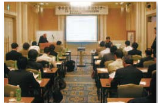
中小企業会計啓発普及セミナー

その他、「AISHIN REPORT 2009」で誌面を刷新し見易く分かり易いものにした等お客様へのサービス向上を図ることにより、持続可能な地域経済への貢献を推進しております。