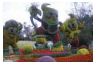
あいしん倶楽部 年金友の会

11月19日～20日 あいしん倶楽部 年金友の会を開催しました。 「【浜松モザイクカルチャー世界博2009】と大人の社会見学を楽しむ御前崎1泊2日の旅」