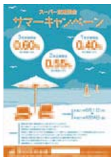
サマーキャンペーン