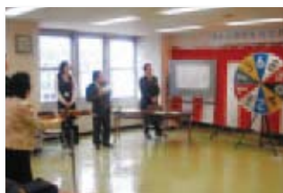
懸賞金付定期預金「夢」の抽選会

11月19日～20日 あいしん倶楽部 年金友の会を開催しました。 「【浜松モザイクカルチャー世界博2009】と大人の社会見学を楽しむ御前崎1泊2日の旅」