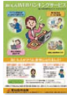
インターネットバンキング