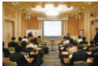
中小企業会計啓発普及セミナー