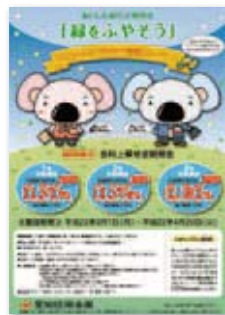
緑化定期預金「緑をふやそう」

3月 1日 キャラクター登場キャンペーン あいしん緑化定期預金「緑をふやそう」発売。