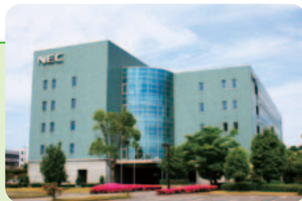
信金バックオフィスセンター

平成20年7月、当金庫は、愛知県下の2信用金庫及びNECと共に、為替集中業務システムとその運用業務を一括して請け負う「信金バックオフィスセンター」を設立し運用を開始しました。これにより、窓口での振込・総合振込・給与振込などの膨大な人手作業を要する各種為替事務処理を、「信金バックオフィスセンター」において専属のオペレータが行い、最新のイメージ処理システムを採用して、効率的かつ高セキュリティで業務をおこなっています。