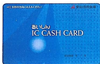
IC キャッシュカード

平成 20 年 8 月から平成 25 年 9 月までに発行された「IC カード」（IC キャッシュカード、及び、IC ローンカード）には、10 年間の有効期限があり、平成 30 年 8 月より、順次、有効期限を迎え有効期限の翌月以降はご利用できなくなります。